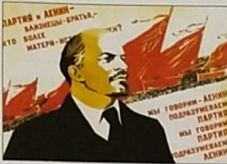
Bìa 1: Kỷ niệm 151 năm ngày sinh V.I. Lenin (22-4-1870 – 22-4-2021)